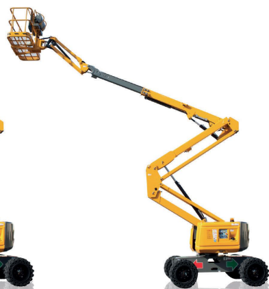
HA16 RTJ O