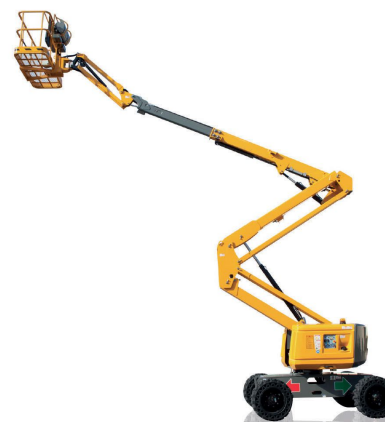
HA16 RTJ PRO